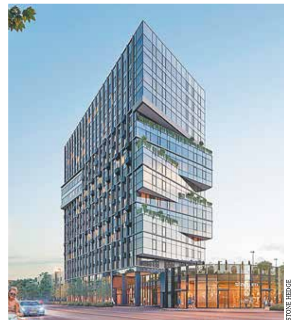
Проект Клубного дома Story

Отдельного разговора заслуживает архитектура комплекса. Story спроектирован ТПО «Резерв» — одним из крупнейших в Москве архитектурных бюро. 16-этажное здание выдержано в функциональном стиле. В декоре фасадов использованы современные материалы: стекло и панели из объемной керамики, хорошо сочетающиеся