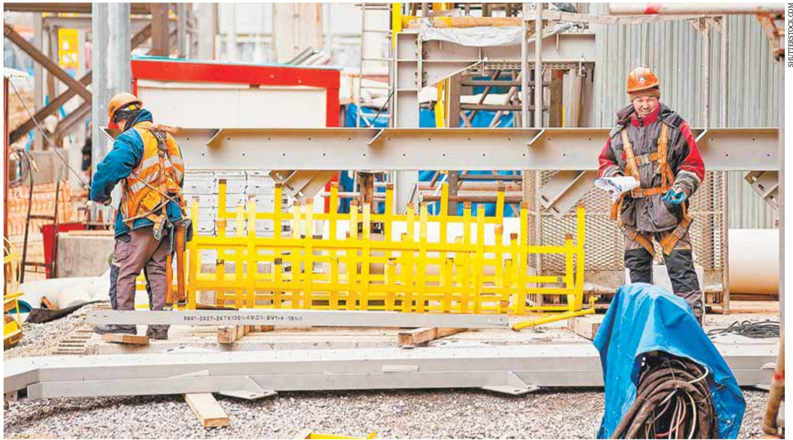
Доля зарплаты (с учетом накладных расходов) в стоимости строительства может достигать 35%

Ответы на эти и другие вопросы, связанные с применением ресурсного метода, еще предстоит дать. А пока необходимо «разморозить» использовавшийся ранее базисно-индексный