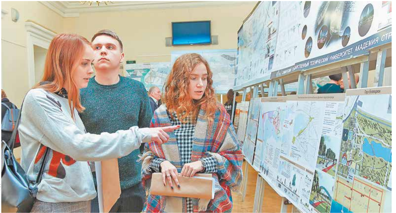
Финал Общероссийского конкурса студенческих работ в области универсального дизайна и создания безбарьерной городской среды для маломобильных групп населения 2017-2018 года

В последние годы проблеме доступности уделяется в России много внимания. Примерно 9% граждан страны имеют инвалидность, многие являются инвалидами с детства. Еще в 2008 году