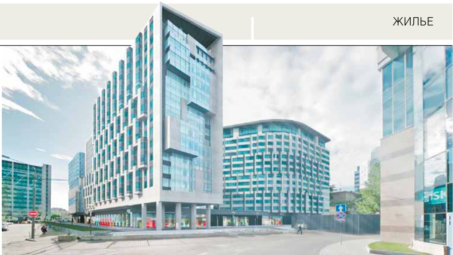
Проект многофункционального комплекса на Киевской улице в Москве