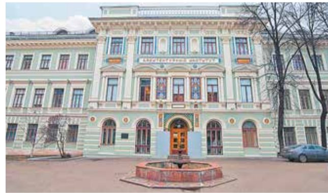
Здание Московского архитектурного института

Молодые архитекторы предложили свои решения по созданию безбарьерной среды в Саках