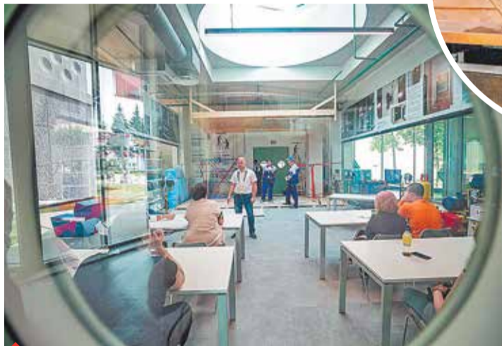
На занятии по общестроительным работам

В комплексе Техноград имеется 2 960 единиц специализированного профессионального оборудования, в том числе уникальные образцы. В мастерских используется новейшая аппаратура, например, киберфизическая фабрика CP Lab, установка послыного лазерного синтеза EOS M100 с лазером 200 Вт, пищевой 3D-принтер Foodini, профессиональная студия звукозаписи и многое другое.