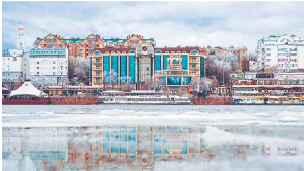
Вид на набережную Ростова-на-Дону с левого берега Дона

О.М.: Ярким примером комплексной застройки стал жилой район «Левенцовский», расположенный в Советском рай-