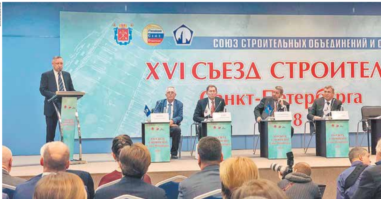
На съезде строителей Петербурга выступил врио губернатора Александр Беглов (слева)

Петербургские строители и чиновники обменялись на съезде претензиями