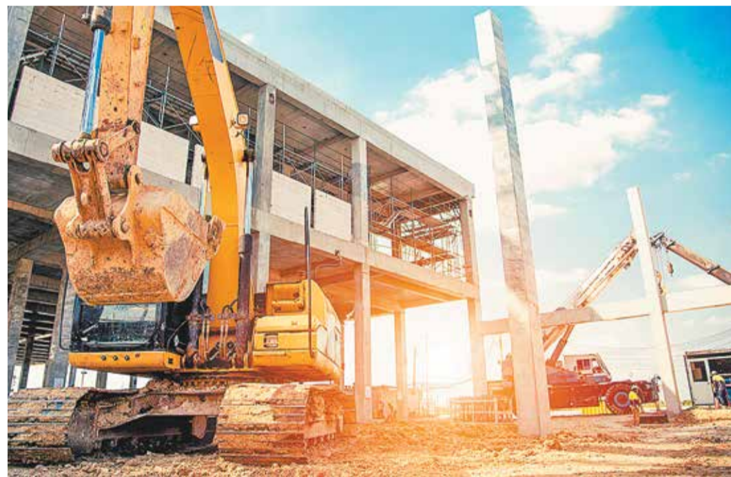
Расходы на эксплуатацию машин и механизмов — важный элемент цены любого капитального объекта

Изменение системы ценообразования в строительстве не должно стать шоком для отрасли