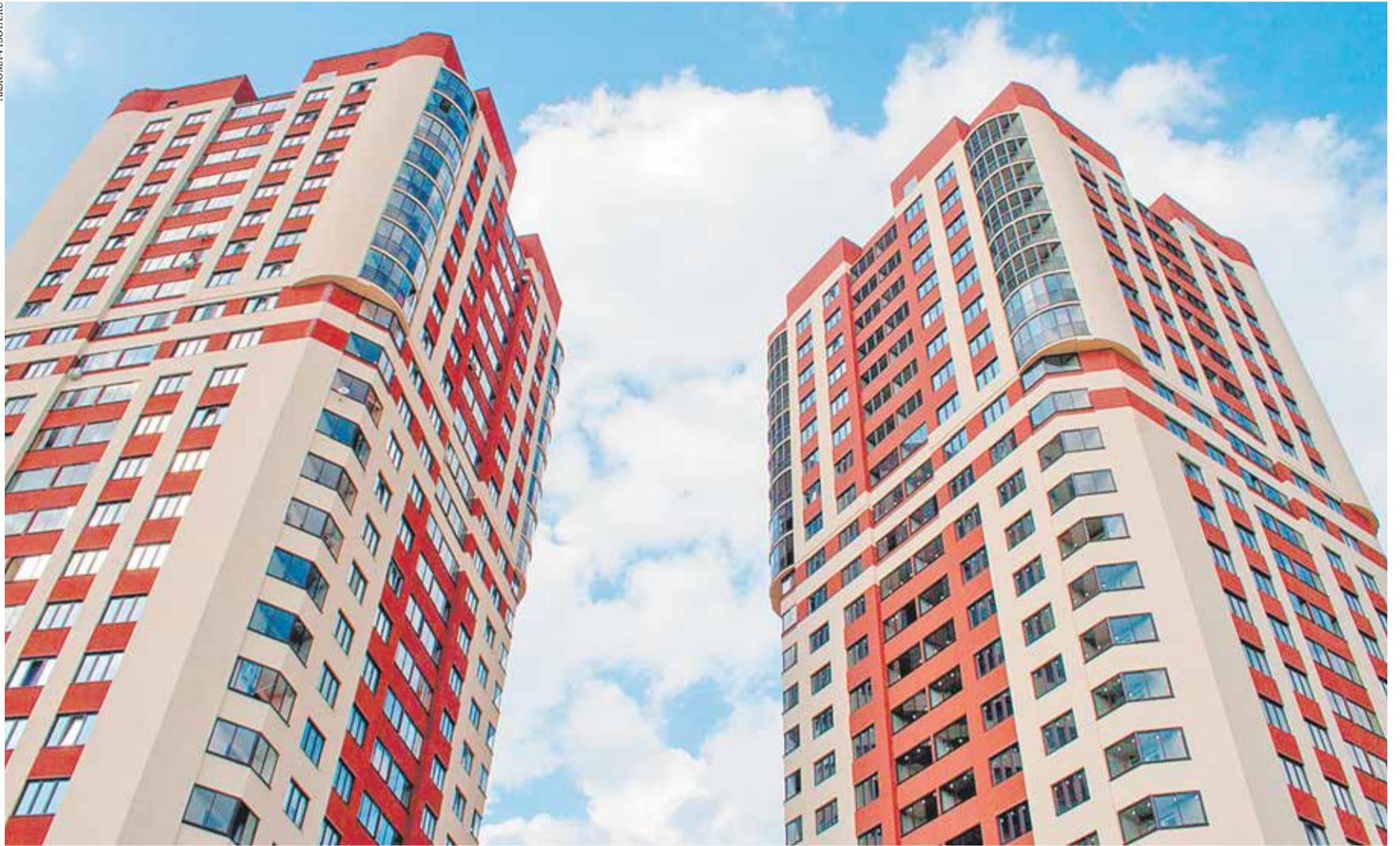
28-этажный ЖК «Высота» в Воронеже

С 2015 года Институт развития строительной отрасли (ИРСО/ irso.ru) при поддержке Национального объединения застройщиков жилья (НОЗА) ведет постоянный мониторинг всех открытых сведений о жилищном строительстве в России, осуществляемом профессиональными застройщиками. Для этого специалисты ИРСО изучают муниципальные реестры выданных разрешений на строительство, на ввод в эксплуатацию, проектные декларации застройщиков и многое другое. Результаты этой большой аналитической работы, посвященной ситуации на крупнейших региональных рынках жилищного строительства, и передаются «СГ» на эксклюзивных условиях с 2017 года. Ранее в этом году в «СГ» уже вышли обзоры новостроек Подмосквья (№8), Москвы (№9), Санкт-Петербурга (№12), Ростовской (№17), Ленинградской (№19), Тюменской (№36), Свердловской (№42), Новосибирской (№46), Самарской (№48) областей и Республик Татарстан (№38) и Башкортостан (№40). С полной версией мониторингов ИРСО можно ознакомиться на портале «Единый реестр застройщиков» (erzrf.ru).