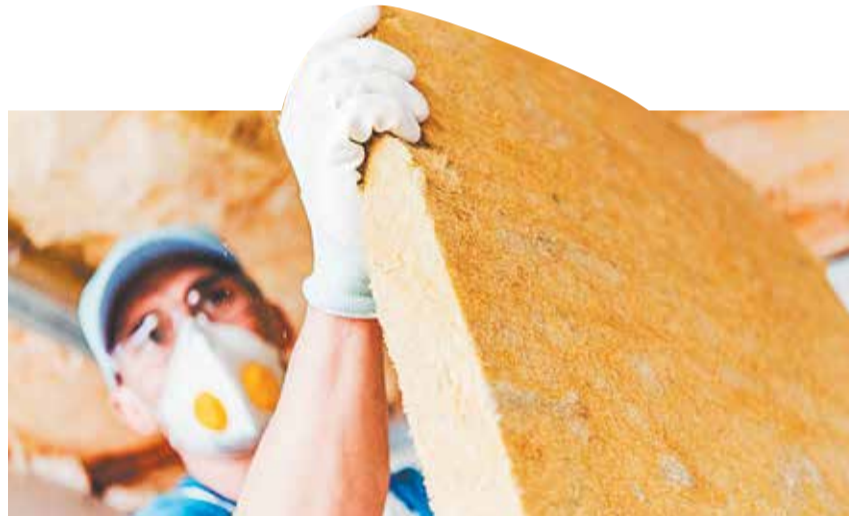
Строительные материалы — одна из главных статей расходов строителей

метод — такое поручение Минстрой уже получил от заместителя председателя правительства Российской Федерации Виталия Мутко. При этом в течение двух лет регионы с высокой степенью готовности к мониторингу, в числе которых Москва, Московская область, Челябинск, Владимир и некоторые другие, смогут пользоваться ресурсно-индексным методом, который объединит элементы двух подходов. Полученные на территории этих «пилотных» регионов данные будут пере-