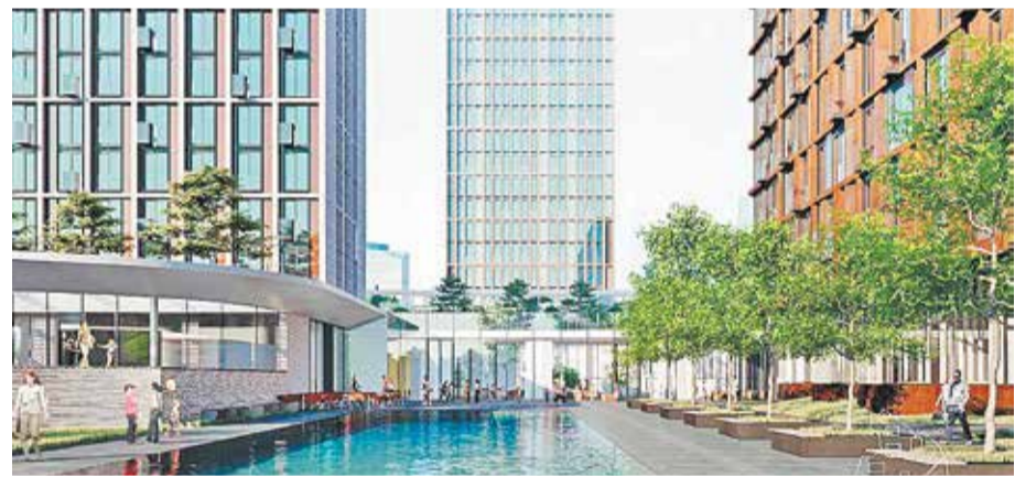
Проект жилого комплекса в 1-м Сетунском проезде