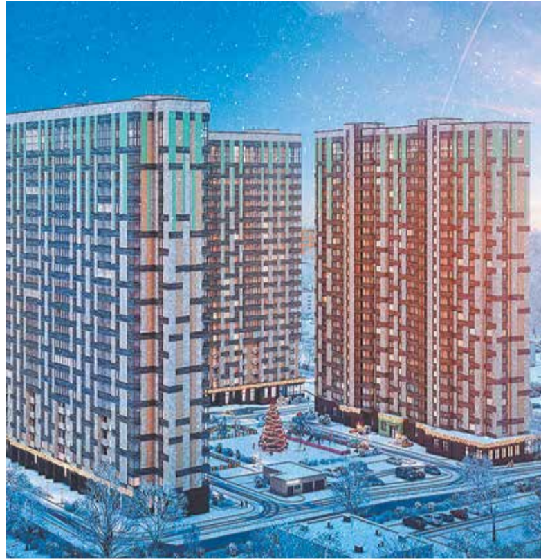
ЖК «Настроение» в Москве

Большой популярностью, помимо студий и однокомнатных квартир, пользовались двухкомнатные квартиры, спрос на которые заметно вырос в сравнении с предыдущими периодами и составил около 35% от общего объема спроса. Средний бюджет покупки в проектах компании составил 4,9 млн руб. (против 4,3