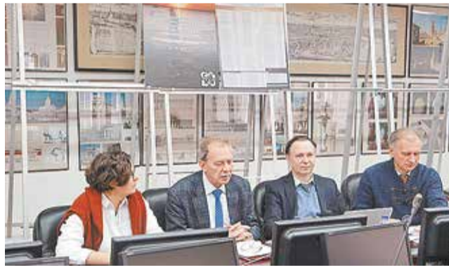
Члены жюри конкурса во время обсуждения студенческих работ

Молодые архитекторы предложили свои решения по созданию безбарьерной среды в Саках