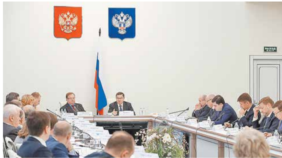
На заседании президиума Общественного совета при Минстрое России. В центре: глава совета Сергей Степашин и министр строительства и ЖКХ России Владимир Якушев